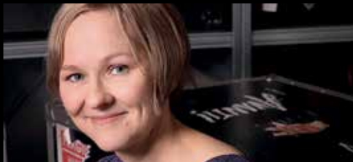
Säveltäjä / Composer Lotta Wennäkoski