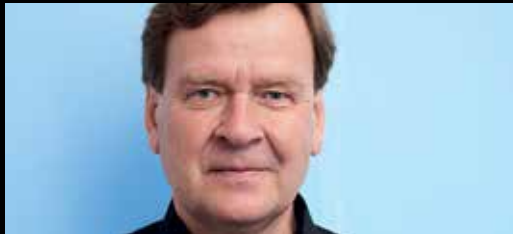
Säveltäjä / Composer Magnus Lindberg