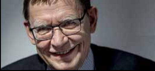
Tuomariston pj., säveltäjä / Composer, Chairman Kalevi Aho